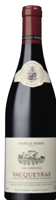
FAMILLE PERRIN VACQUEYRAS AOC LES CHRISTINS 2017, 75 CL

AUSZEICHNUNGEN: 92 – 94 Pts JEB DUNNUCK, 92 Pts WINE SPECTATOR, 90 – 92 Pts ROBERT PARKER