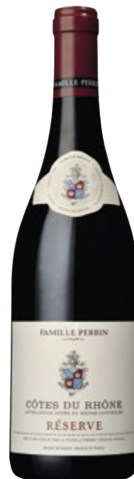
FAMILLE PERRIN CÔTES DU RHÔNE AOC RÉSERVE ROUGE 2017, 75 CL

GEPRÄGT DURCH DIE VIOGNIER TRAUBE UND SEINE BLUMIGEN NOTEN, IST DIES EIN WEIN MIT EINER UNGLAUBLICHEN FRISCHE UND GROSSER TIEFE. ER PASST HERRVORRAGEND ZU ALLEN MEDITERRANEN GERICHTEN UND FISCH.