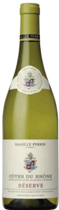
FAMILLE PERRIN CÔTES DU RHÔNE AOC RÉSERVE BLANC 2019, 75 CL

VOM BESITZ DES LEGENDÄREN CHÂTEAU DE BEAUCASTEL BIS ZUR ZUSAMMENARBEIT MIT BRAD PITT UND ANGELINA JOLIE IN MIRAVAL IST DIE FAMILIE PERRIN SEIT ÜBER EINEM JAHRHUNDERT ERFOLGREICH UND BEKANNT FÜR UNKONVENTIONELLE NEUE IDEEN. DIE FAMILIE PERRIN WURDE AUCH AUS DIESEM GRUND VOM EINFLUSSREICHSTEN WEINMAGAZIN EUROPAS, DEM DECANTER MAGAZINE, ZUR PERSÖNLICHKEIT DES JAHRES 2014 GEWÄHLT. DIE FAMILIE BESITZT HEUTE ZENTRALE WEINBERGE AUF DEN BESTEN BÖDEN IM SÜDEN DES RHÔNE-TALS. DIE PERRINS SIND SOWOHL PIONIERE IM WEINBAU WIE AUCH VISIONÄR: SEIT 1953 SIND SIE PIONIERE DES ÖKOLOGISCHEN LANDBAUS UND PRODUZIEREN SEIT 1970 BIODYNAMISCH. SIE HABEN ERSTMALS IN DEN USA RHÔNE-REBSORTEN ANGEBAUT UND WAREN 1989 DIE ERSTEN, WELCHE PASO ROBLES ANGEBAUT HABEN. DURCH DEN BETRIEB DES RESTAURANTS UND DES L'OUSTALET-HOTELS IM HERZEN DES DORFES GIGONDAS BEWEIST DIE FAMILIE AUCH, DASS SIE AN DIE REGION GLAUBT UND DIESE DADURCH FÖRDERN MÖCHTE.