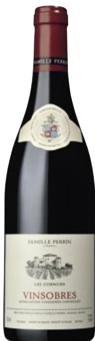
FAMILLE PERRIN VINSOBRES AOC LES CORNUDS 2017, 75 CL

DIE NASE ZEIGT KOMPLEXE AROMEN DIE VOM GRENACHE HERRÜHREN. ANKLÄNGE VON CASSIS, DIE VOM REIFEN SYRAH STAMMEN. AM GAUMEN WIRD EINE BESTIMMTE KOMPLEXITÄT MIT NOCH SEHR PRÄSENTEN TANNINEN DEUTLICH, GLEICHZEITIG ABER AUCH EINE SCHÖNE FINESSE, ELEGANZ UND FRISCHE. KLASSISCHER CÔTES DU RHÔNE. FRUCHTIG, FRISCH UND FLEISCHIG, MIT WUNDERSCHÖNEN TANNINEN. EIN GROSSARTIGER WEIN FÜR JEDEN TAG.